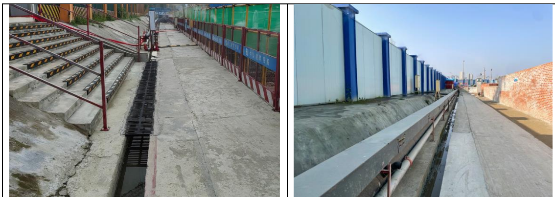
图 3-1 主体工程区施工期间照片