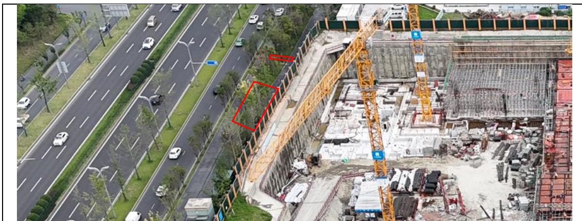
图 3-4 场外衔接工程区现状照片