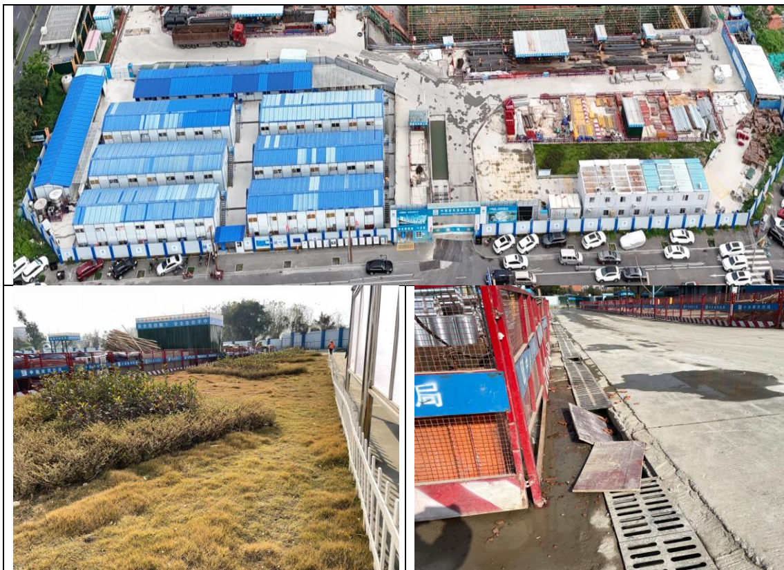
图 3-3 施工生产生活区现状照片

经施工、监理资料查阅及复核,施工生产生活区已布置完成,本季度未实施水土保持措施。