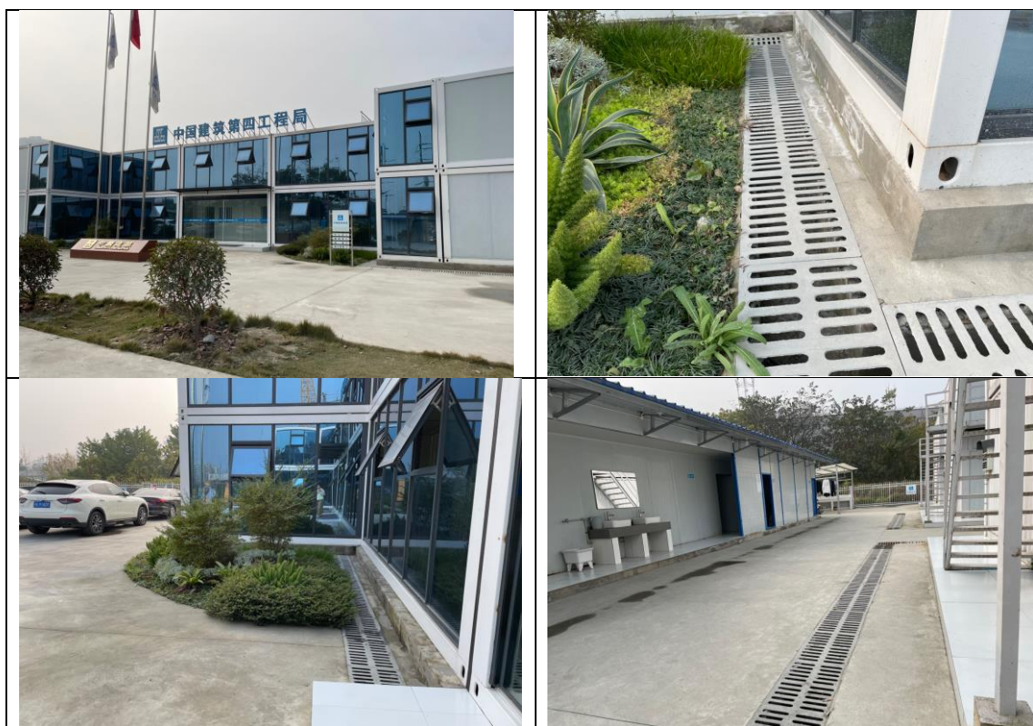
图 3-2 施工办公区现状照片